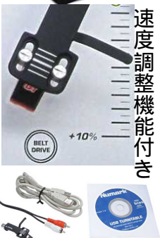
速度調整機能付き +10% BELT DRIVE

iPTUSB ビidders bidsders 最安価格 15,910円 ポータブルUSBターンテーブル