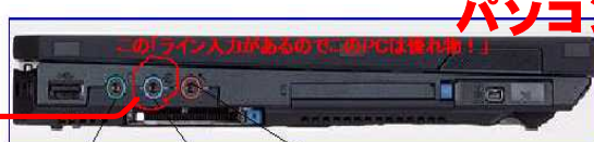
ヘッドホン端子 ライン入力 マイク入力端子

ステレオミニコネクタにアンプのライン入力へつないで音を出す レコードプレーヤーやMDをステレオミニコネクタで接続する