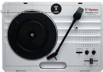
速度調整付き レコードプレーヤー