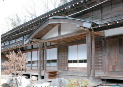
石井家住宅(許可なく立ち入りできません。)