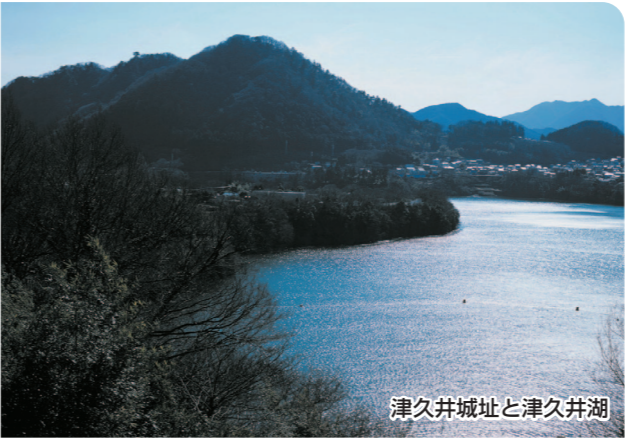
津久井城址と津久井湖