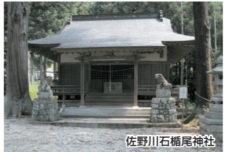
佐野川石橋尾神社