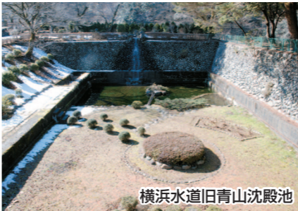
横浜水道旧青山沈殿池