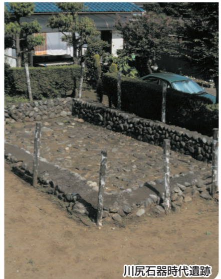
川尻石器時代遺跡