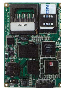
組み込みハードウェアの例

基板上のメモリに組み込まれる組み込みソフトウェアは近年、複雑化、大規模化が進んでいます。一般に、複雑化・大規模化した組み込みソフトウェアでは、効率性・信頼性の確保などのために、組み込み用に設計された OS が使用されます。