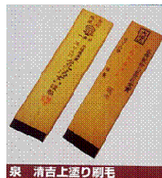
泉 清吉上塗り刷毛

お椀などの漆器に漆を塗る時に使用する刷毛です。現在では、製作者が1～2名程度となってしまいました。女性の髪毛を使用して作られます。最高級の漆刷毛は日本女性の古かもじを使用したものですが、日本髪を結う女性がいなくなって古かもじを入手できなくなり、途絶えるのは時間の問題となっています。現在は主に、中国人の女性の髪毛などが使用されています。